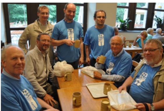
Le comité des fêtes

Ce concert termine notre journée de fête et on se dit: Quelle chance d'avoir un comité des fêtes qui, chaque année, se démène pour offrir aux paroissiens de St-Pierre une journée si enrichissante. Les absents ont manqué quelque chose cette année car c'était un grand cru !