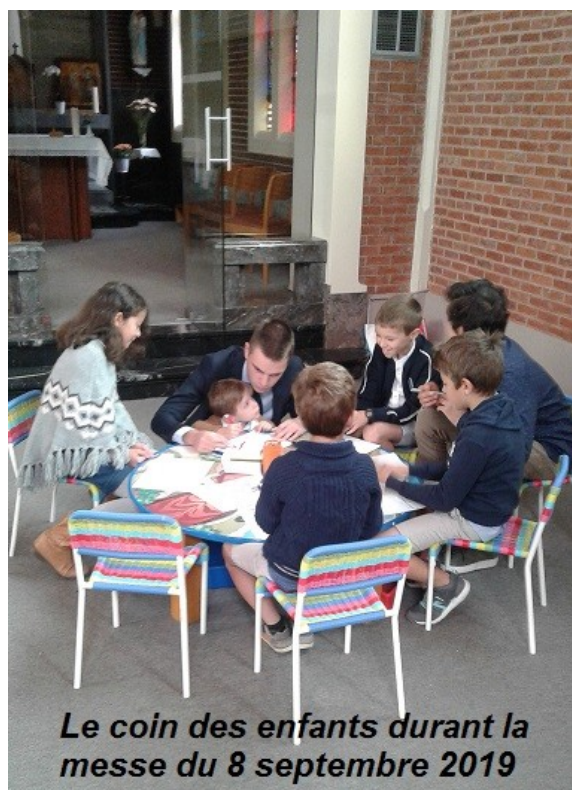
Le coin des enfants durant la messe du 8 septembre 2019

Voir aussi le Site de l'Unité Pastorale www.bourgeros.be